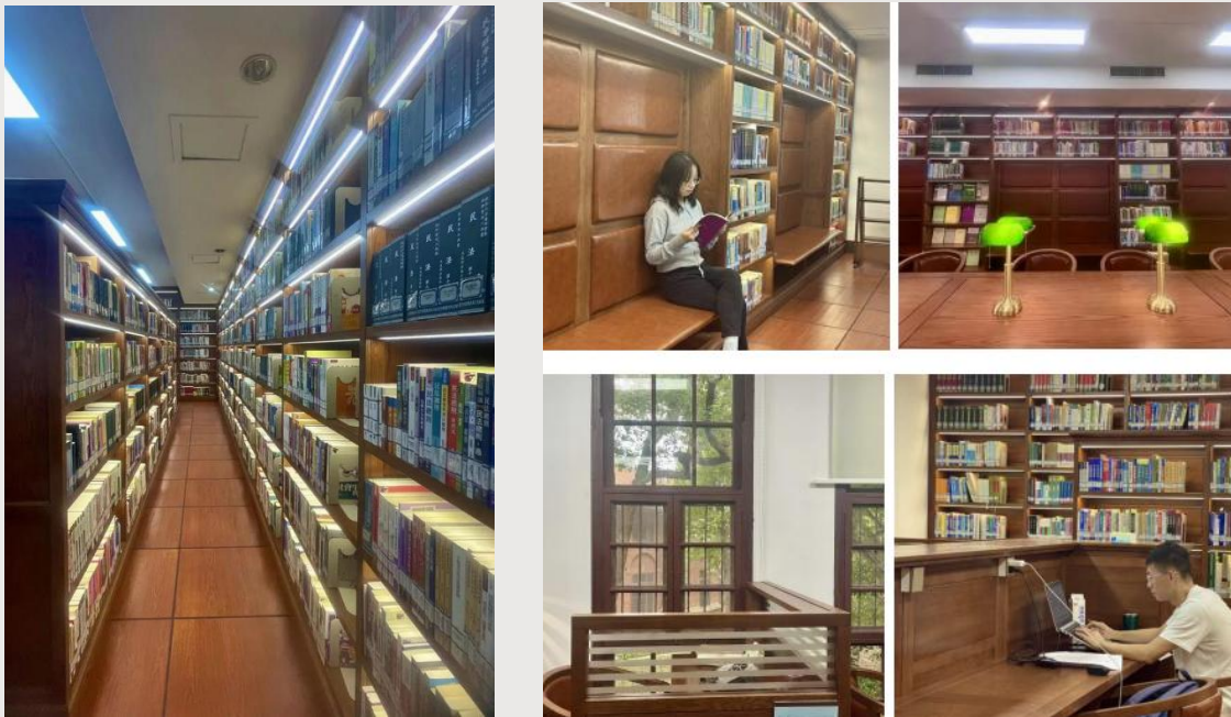
港澳台资料中心、读者书架、阅览室

1. 港澳台资料中心： 港澳台原版图书、期刊原件难以检索？五号楼一楼港澳台资料中心满足你！在这里，你可以获得全方位的港澳台图书资料和各类中文期刊合订刊，再也不用在网上苦苦寻找啦！