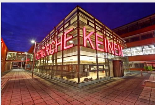
明斯特大学图书馆总馆 2 :